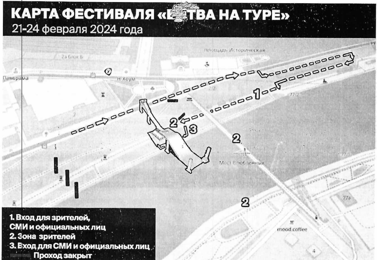
Схема 1. Карта фестиваля «Битва на Туре»